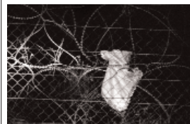
Weltpressefoto 2008

Weltpressefotopreis für Israeli Der israelische Fotograf Yonathan Weitzman hat bei der Wahl zum Weltpressefoto des Jahres in der Kategorie 'Menschen in den Nachrichten' einen ersten Preis gewonnen.